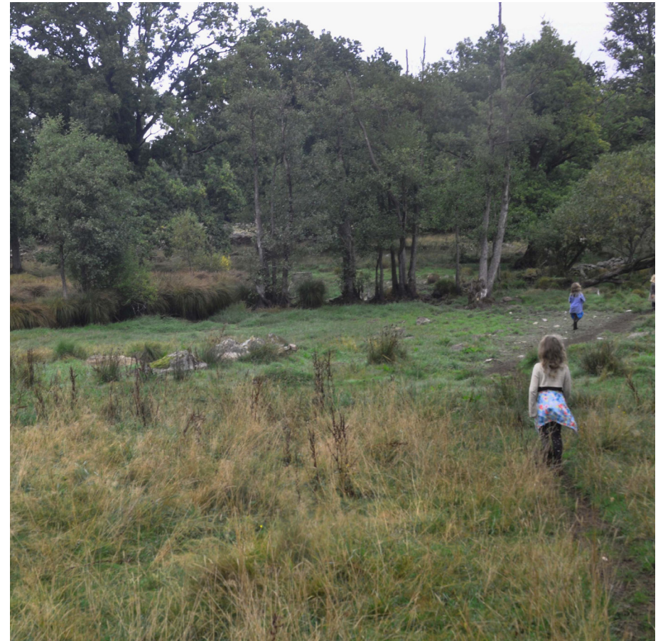
Det finns en massa kul att hitta på i skogen!

Den här lilla snoken bredvid våra programpunkter betyder att barn är extra välkomna, i sällskap med en vuxen förstås, och att utflykten kan vara spännande för små natursnokar. Alla nyfikna är välkomna!