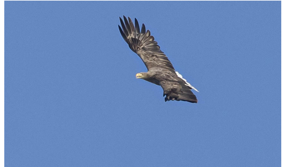
Adult havsörn.

Varma kläder och varm dryck rekommenderas. Ta med kikare och fågelbok om du har. Tag också med mugg eller djup tallrik till ärtsoppan och en sked!