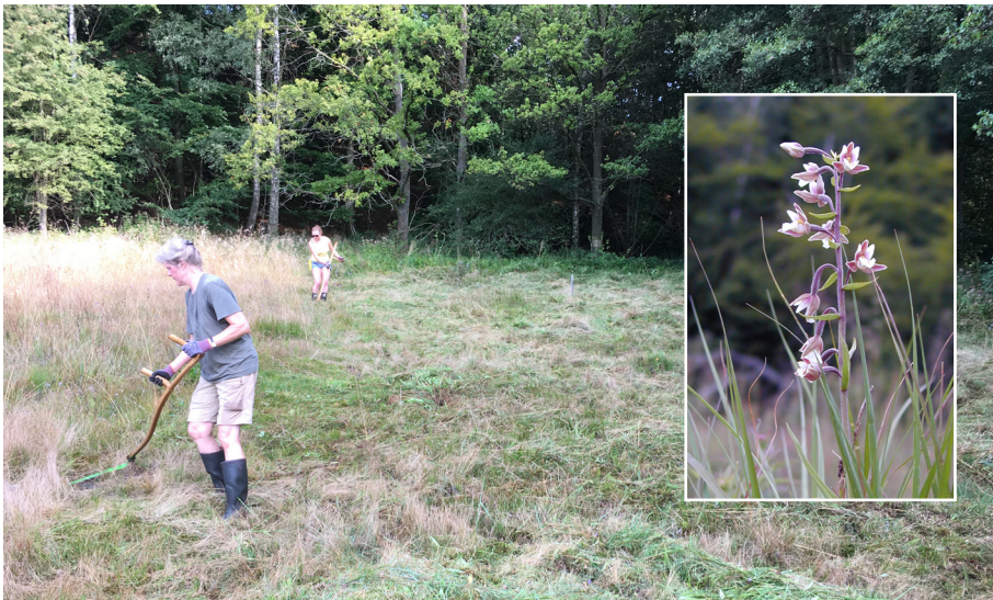
Med lie i Vitabäckskällan. · Kärrknipprot.

Varmt välkomna att göra en praktisk naturvårdsinsats!