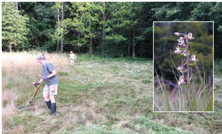
Med lie i Vitabäckskällan. Foto: Dan Gerell · Kärrknipprot. Foto: Rune Gerell

Varmt välkomna att göra en praktisk naturvårdsinsats!