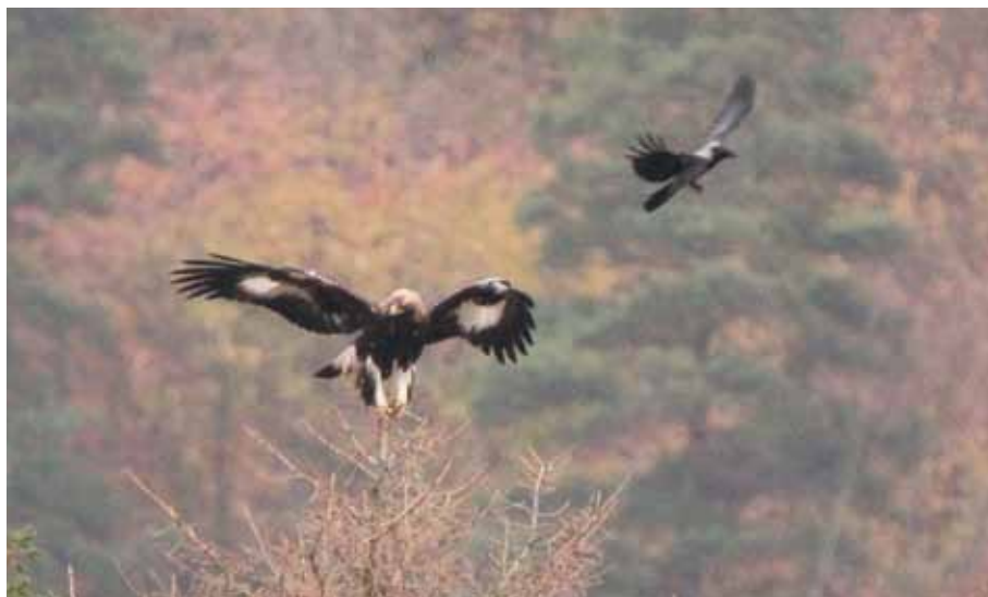
Kungsörn och kråka.

Varma kläder och varm dryck rekommenderas. Ta med kikare och fågelbok om du har. Tag också med mugg eller djup tallrik till ärtsoppan och en sked!