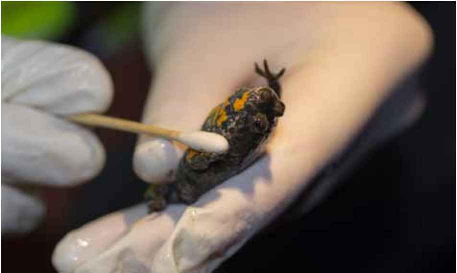
Klockgroda som topsas.

Föreningen bjuder på fika - alla är välkomna!