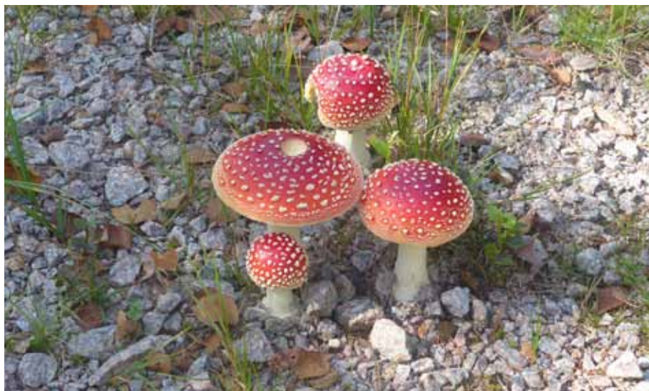
Röd flugsvamp.

Tag med svampkorgen, kläder efter väder och fika! Väl mött!