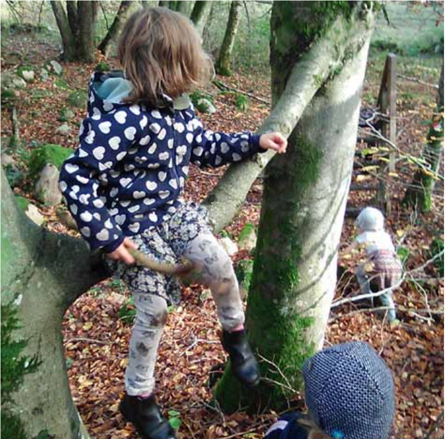
Det finns en massa kul att hitta på i skogen!

Den här lilla snoken bredvid våra programpunkter betyder att barn är extra välkomna, i sällskap med en vuxen förstås, och att utflykten kan vara spännande för små natursnokar. Alla nyfikna är välkomna!