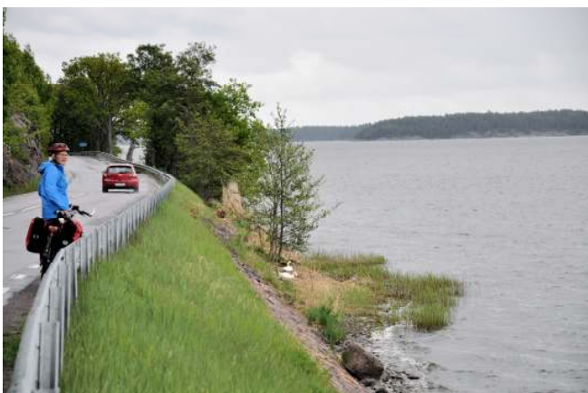
Trafikerat men vackert vid Bråviken.

Från järnvägsstationen cyklar du västerut och följer en cykelbana längs Stockholmsvägen. Den fortsätter till Åby. Där följer du Nyköpingsvägen tills den når den gamla riksvägen längs Bråviken. Här måste du cykla på en ganska trafikerad väg i fem km innan du ska ta av uppför berget mot Strömsfors. Här är det mycket lugnare. Från Stavsjö är den gamla riksettan bred igen in till Nyköping.