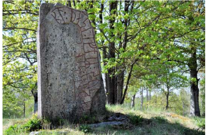
Vid Hamneda finns flera fornminnen, bl a denna runsten.

väg mot Kånna. Från Kånna är banvallen asfalterad in till Ljungby.