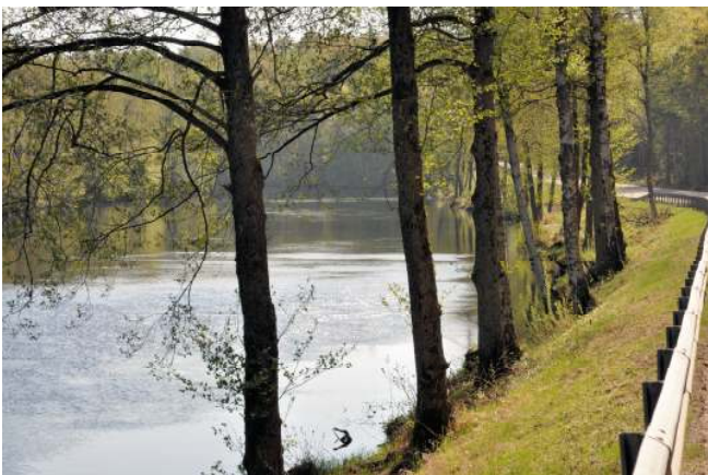
Den gamla riksvägen följer Lagan.

Cykla norrut via Timsfors på den gamla riksettan till Strömsnäsbruk och Traryd. Den är något trafikerad under pendlingsstider.