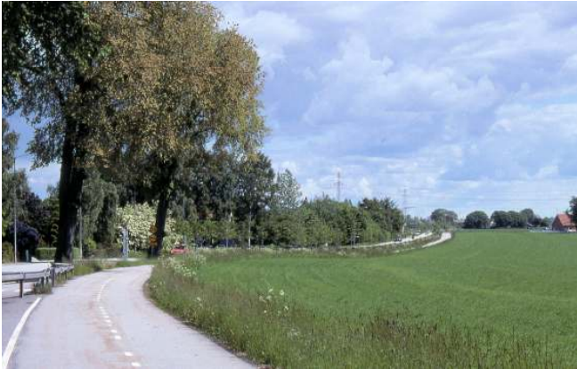
Cykelvägen mellan Malmö och Lund.

Starta cyklingen i korsningen Kaptensgatan – Kungsgatan på ett av Malmös stora cykelstråk, nära Södertull, strax söder om kanalen. Därifrån finns en skyltad cykelbana hela vägen till Lund via Arlov och Åkarp. I Lund visar skyltarna mot Stortorget .