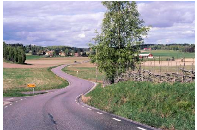
Vägen från Mörkö mot Tumba.

Cykla norrut från centrum och följ Näckrosleden. De första fem km är cykelbana. Där cykelvägen slutar ska du fortsätta en knapp km på landsvägen. Sväng sedan till höger mot Södertälje. Efter sju km, vid Valåker, kan du ta till höger och cykla på en äldre landsväg. Där den slutar ska du ta till höger mot Mörkö. Cykla norrut på vägen över Mörkö. Där den tar slut finns en vägfärja. Följ vägen via Eldtomta. Före Vårsta får du cykla en km på en väg med stark trafik, men sedan finns det cykelbana till Tumba.