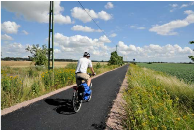
Banvallar ger behaglig cykling utan störande trafik.

Cykla västerut från Stortorget. Efter järnvägen fortsätter du åt nordväst på Fjelievägen. En bit ut börjar skyltar mot Kävlinge. Det är cykelbana i princip hela vägen.