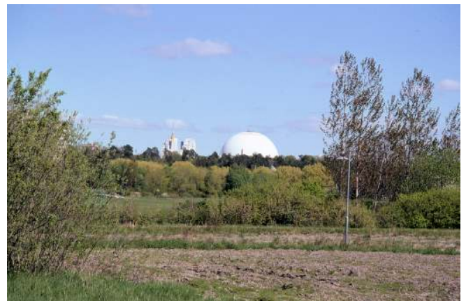
När du ser Globen är målet nära!

Från Tumba kan du cykla på cykelbanor och villagator via Älvsjö in till Stockholms centrum. En fin väg går via Alby, Glömsta och Gamla Stockholmsvägen.