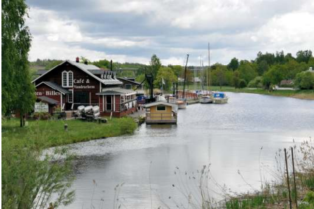
Göta Kanal vid Norsholm. Här är det liv och rörelse under sommartid och det är ofta broöppning.

om Gistad finns en väg mot Lillkyrka. Kör förbi den. Strax efter denna korsning tar du till vänster på en äldre landsväg som går längs med den nyare. Cykla sedan under motorvägen och fram till Norsholm. Där cyklar du in i samhället och över Göta kanal.