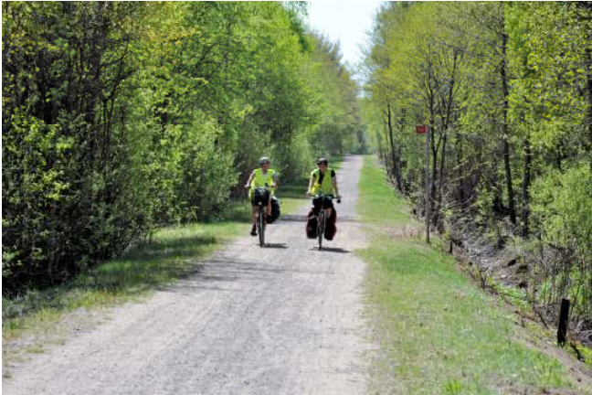
Banvallen vid Åsljunga går vackert genom lövskog och du slipper trafikbuller.

Från Örkelljunga cyklar du 15 km på en gammal banvall (grus) via Åsljunga till Skånes Fagerhult. Där cyklar du till höger (österut) uppför backen till den gamla riksettan mot Markaryd. R1 är här bred med väggen och med måttlig trafik.