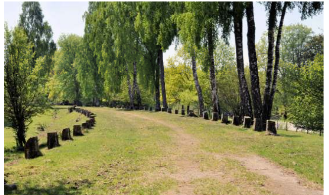
Vid Toftaholm finns en ännu äldre riksväg kvar. Stanna till och njut av eklandskapet och utsikten över sjön Vidöstern.

Från centrum cyklar du österut på Norra Järnvägsgatan och på en bro över Lagan. Följ ån norrut på en liten väg på den östra sidan fram till samhället Lagan. Där får du åter cykla på den gamla riksvägen. Norr om korsningen med motorvägen är vägen bred.