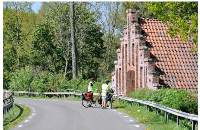
Vägen går vackert förbi Rosendals slott.

Från Knutpunkten kan du cykla uppför backarna via Långvinkelsgatan. Den är brant men kort. Cykla sedan förbi Fredriksdal, längs Vasatorpsvägen och österut över motorvägen. På småvägar cyklar du förbi Kropps kyrka och Rosendals slott. Vägen går under motorvägen och därefter måste du köra österut en km på en trafikerad väg med vägren. Strax före motorvägskorset ska du ta till vänster (norrut) för att cykla på småvägar till Åstorp. Missa inte cykelvägen från Nyvång längs järnvägen.